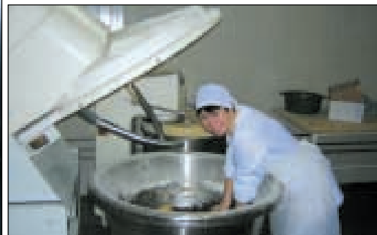
Die russischen Mitarbeiter werden von Dresdner Bäckern bei der Christstollenherstellung angeleitet

Tag der offenen Tür in der „Pjekarna Scholze“. Die Eröffnung der Produktionsstätte stieß auf reges Interesse der Moskauer Bürger