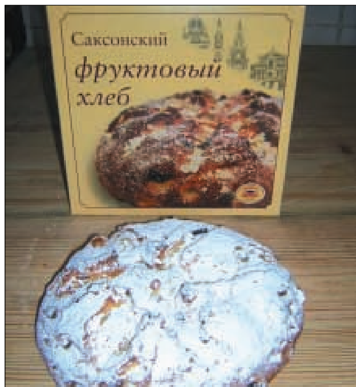
Die russischsprachige Verpackung für Sächsisches Früchtebrot

Internetadresse für Bestellungen: www.dresdner-christstollen-online.de