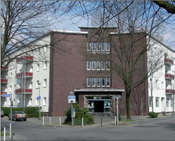
Der Haupteingang des ehemaligen Finanzamtes und jetzigen Beginnenhofes ...