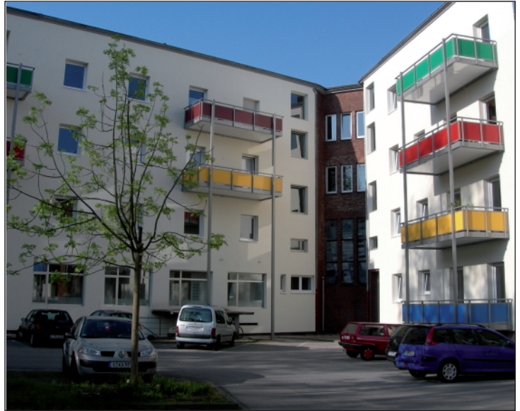
... und der neu gestaltete Innenhof

zu erwerben. Im Januar 2007 war es dann soweit. Der Umbau konnte beginnen. Die Amtsstuben wurden sukzessive in 24 Wohnungen, 14 Appartements, diverse Gemeinschaftsräume und 10 Büro- bzw. Praxisräume sowie in ein Cafe umgestaltet. Dabei wurden die zukünftigen Bewohnerinnen von Beginn an in die Planung einbezogen und am Umbau beziehungsweise an der Ausstattung weitgehend beteiligt. Bereits im November desselben Jahres konnten die ersten Frauen in den Beginnenhof einziehen und im Juni des darauffolgenden Jahres wurde die Einrichtung festlich eingeweiht. Rund 700 Gäste nahmen an der Zeremonie teil.